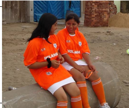
Oranjekoorts in Lima?!